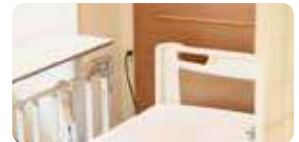
病室・衛生ルーム