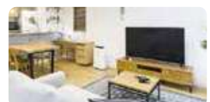
もちろんご家庭でも!