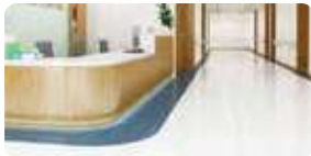
ホテルや病院のロビー