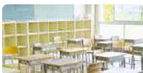
学校や学習塾の教室