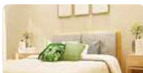
ホテルなどの宿泊施設